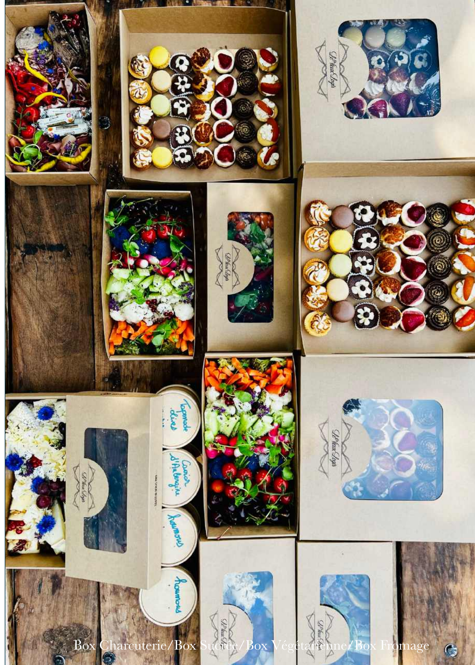
Box Charcuterie/Box Sucrée/Box Végétarienne/Box Fromage

Exemple de composition susceptible de changer